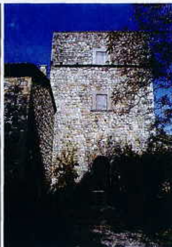
SOPRA. ALCUNE IMMAGINI DALLA MAISON DE CHARME CASTEL VITIANO, NELLA CAMPAGNA DI CASTEL VISCARDO, A POCHI KILOMETRI DA ORVIETO. L'ANTICHITÀ DELLA DIMORA, GLI ARREDI D'EPOCA E L'ESCLUSIVITÀ DEI SERVIZI OFFERTI FANNO DELLA STRUTTURA UN LUOGO MOLTO SUGGERIVO.

altezza sulla Valle del Tevere, vicino all'incantevole borgo medievale di Montecchio e a metà strada tra Orvieto e Todi. La struttura è un'ex-abbazia benedettina e si presenta come un edificio in pietra del XII secolo, con una torre di guardia