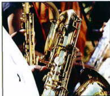
La musica jazz è protagonista di uno dei festival più celebri in Umbria. Tutti di alto livello e per gusti diversi, possono essere l'occasione per un'idea incentive che preveda la partecipazione in esclusiva a uno di questi avvenimenti

■ Perugia: si può conoscere la città attraverso numerosi itinerari tematici, considerata la sua ricchezza artistica e culturale, alla scoperta della città etrusca, delle fontane, dei parchi e dei luoghi più nascosti ( iat@comune.perugia.it ). La città è anche simbolo di vivacità culturale, grazie alla presenza dell'Università degli Studi e dell'Università per Stranieri, che danno un tocco di multietnicità a una realtà decisamente a misura d'uomo. È difficile tracciare itinerari in Umbria che non risultino un mix di tutto ciò che di bello ha questo incredibile puzzle culturale e naturale.