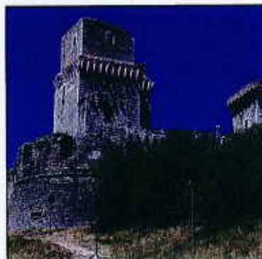
La Rocca Maggiore di Assisi, fra le più interessanti fortezze del Medio Evo. Dalla sua sommità è possibile spaziare con lo sguardo sulla cittadina di Assisi, sulla pianura sottostante e sui declivi del monte Subasio

Un incentive in Umbria non può prescindere dal suo ricchissimo patrimonio culturale, un mosaico artistico e storico prezioso e ben conservato nei centri più conosciuti come Perugia, Spoleto e Assisi e nei numerosi borghi d'origine etrusca. Ma il territorio umbro offre molto anche dal punto di vista naturale e in particolare nel Parco Nazionale dei Monti Sibillini, nel Parco del Monte Subasio e sul lago Trasimeno, luoghi ideali per incentive attivi e all'aria aperta. Fra i numerosi festival, il celebre Festival dei Due Mondi di Spoleto, per far vivere un'esperienza diversa